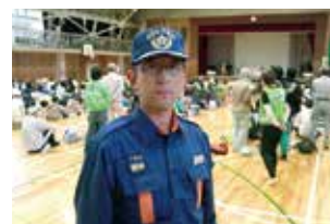
消防団員として地域を守る!