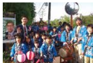
地域の絆、祭りを大切に!