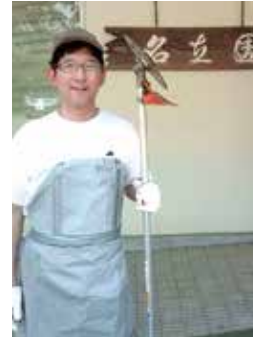
名立園で草刈りボランティア