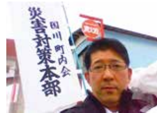
板倉の地すべり現場にて(H24.3.9)