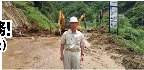
H23.7.31には十日町の水害現場に急行