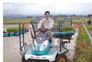
農業体験で田植えのお手伝い