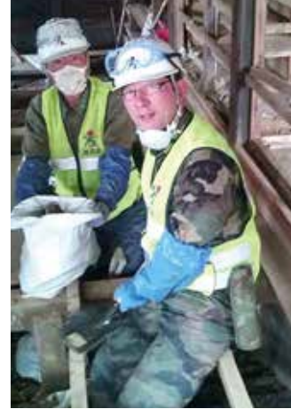
隊友会(自衛隊OB会)の皆さんと 気仙沼市で災害復旧活動