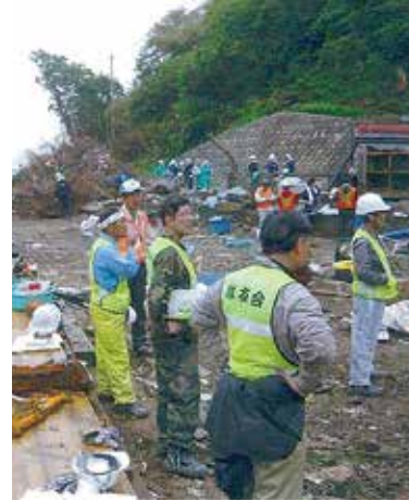
気仙沼市にて災害復旧活動