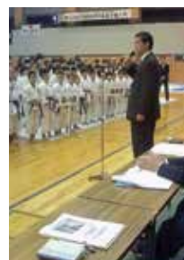
青少年の健全育成!