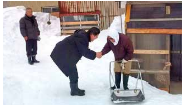
十日町市中里区にて豪雪のお見舞いに回る