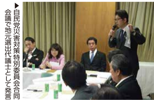
自民党災害対策特別委員会合同会議で地元選出代議士として発言