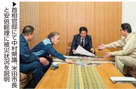
首相官邸にて中村県議、米田市長と安倍総理に被災状況を説明