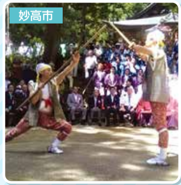
↑関山神社で行われた火祭りの神事に参列、仮山伏の演武を拝見。