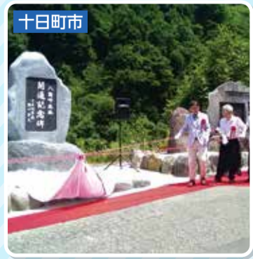
↑昨年開通した八箇峠道路の開通記念碑除幕式に出席して祝辞を述べました。