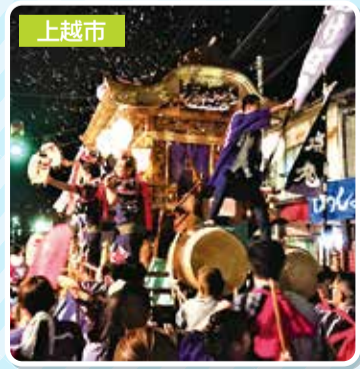
↑直江津祇園祭のフィナーレを飾る「おせん米」で町内の皆様にご挨拶。