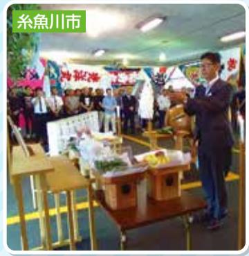
↑毎年恒例の能生港まつりの神事に参列。