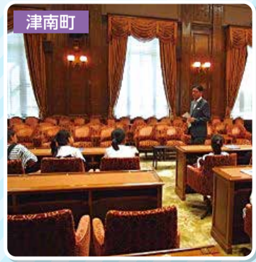
↑国会見学に来てくれた津南町立上郷小学校の子どもたちにご挨拶。