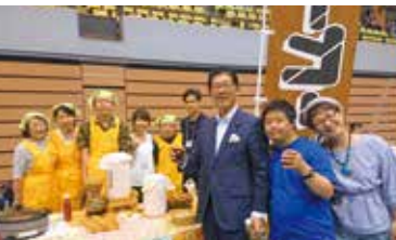
▲「ふくしのひろば」での1枚。市内の障害福祉施設が集まり、触れ合いを目的に行うお祭りです。

◀先日行われた食品衛生法改正の委員会報告で本会議に登壇し、全会一致で可決されました。