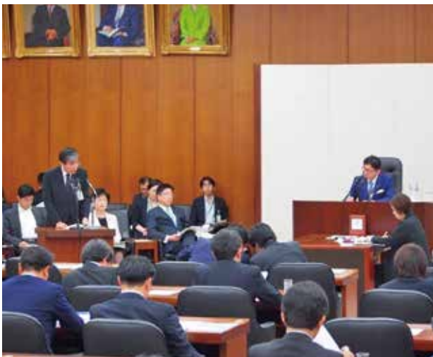
▲衆議院厚生労働委員会での質疑の様子。